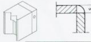
Eck-Naht / Corner weld